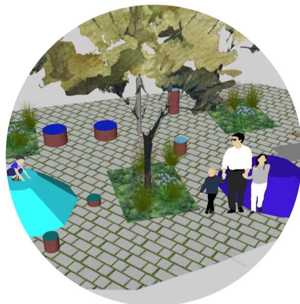
Place Orban Orbanplein