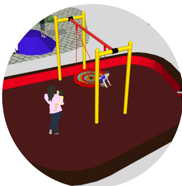
Place Orban Orbanplein