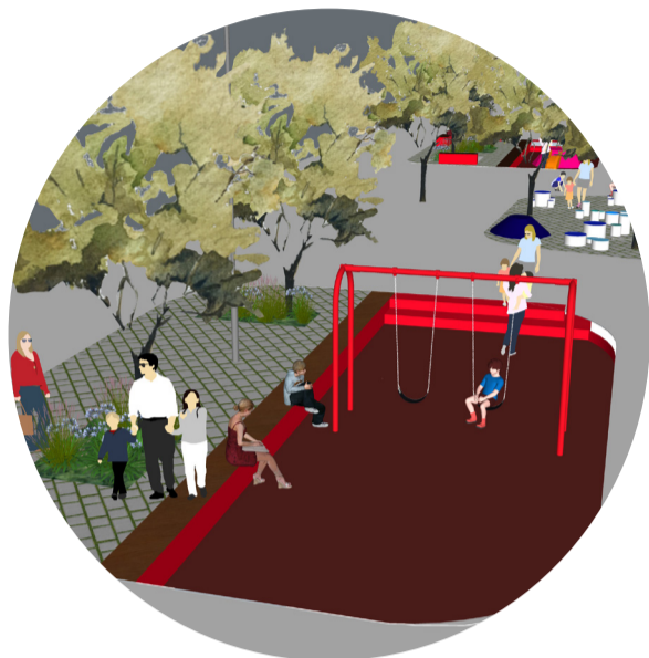
Rue de Padoue Paduastraat