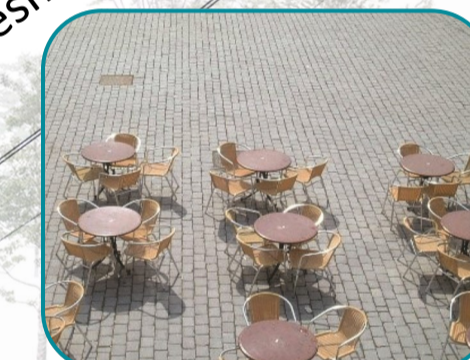
Un sol en granite et la terrasse du CENTR'AL Een granietbodem en het terras van CENTR'AL