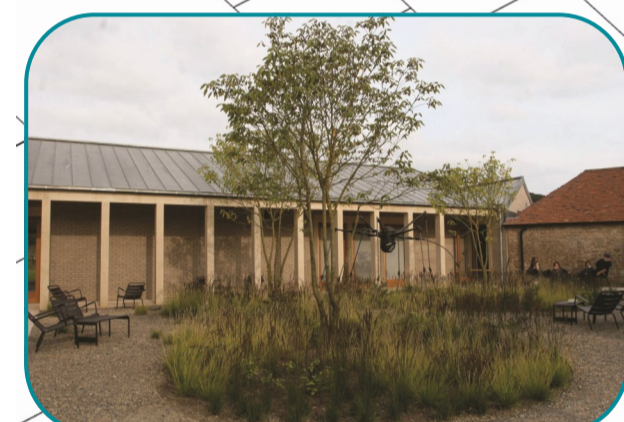
Des plantations autour des arbres Beplantingen rond de bomen