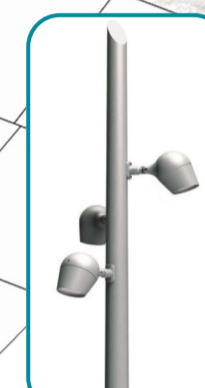
Un nouvel éclairage Een nieuwe verlichting