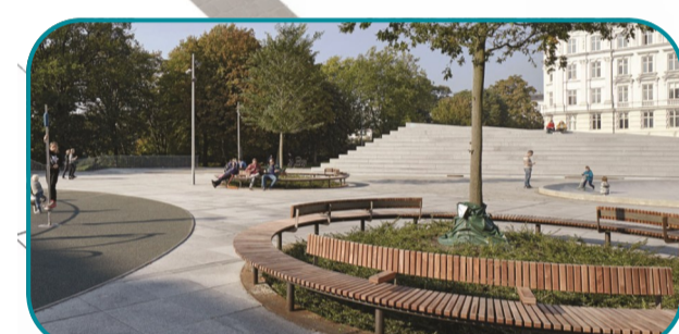
Du mobilier tout neuf Nieuwe stadsmeubilair