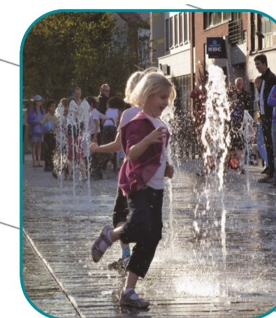
Des jets d'eau ludiques Speelse fontein