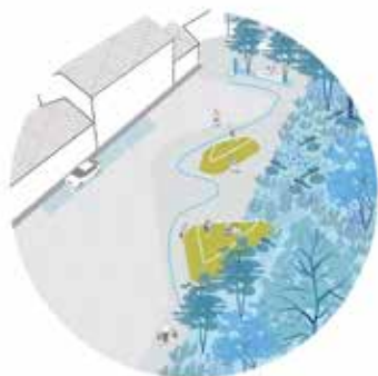
PARVIS DE LA GARE STATIONSVOORPLEIN