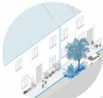
LA RUE DU DRIES DE DRIESSTRAAT