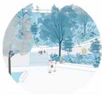
LE PARC DE LA GARE ENTRÉE RUE DE LIÈGE HET STATIONSPARK TOEGANG LUIKSTRAAT

Sous l'impulsion de la cellule Eau, Forest est aujourd'hui une commune exemplaire en région bruxelloise sur la question de la gestion intégrée des eaux pluviales. Ce principe vise à rétablir le fonctionnement naturel du cycle de l'eau en milieu urbain. Le Tracé de l'eau est un des premiers grands réaménagements d'espaces publics qui contribue à sa mise en œuvre.