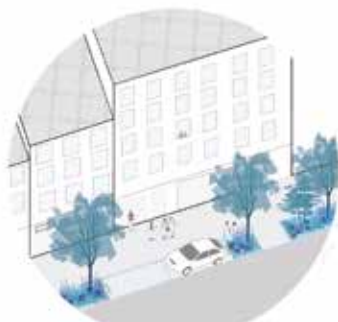
LA RUE VANPÉ DE VANPESTRAAT