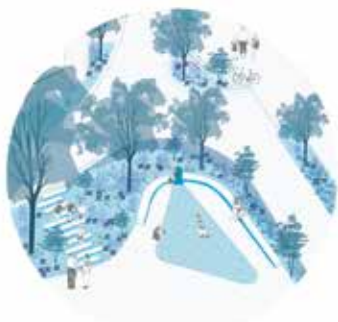
LE SQUARE DE L'EAU DE WATERSQUARE