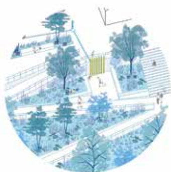
LE PARC DE LA GARE ENTRÉE RUE VANPÉ HET STATIONSPARK TOEGANG VANPESTRAAT